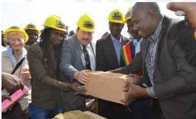
Pose de la première pierre du Centre Socio-Médical et d'Alphabétisation en compagnie de du Maire de Frangy.

Les éditions précédentes ont déjà eu un impact significatif en permettant l'acquisition d'un terrain de 1500 m 2 , la construction du bâtiment du centre socio-culturel, ainsi que la mise en place d'un château d'eau et d'un forage équipé d'une pompe hydraulique fonctionnant à l'énergie solaire.